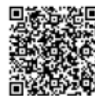
Google Play Store