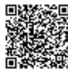
Apple App Store